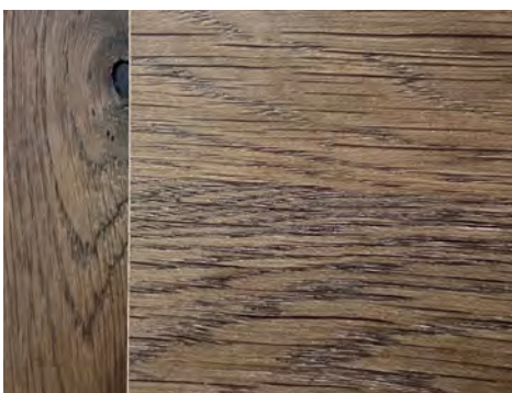
Farbunterschiede durch bewusst geplante Optik auf Futterbrett und Bekleidung möglich.