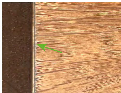
Unregelmäßige Furnierkanten im Kantenbereich möglich.

Im Kantenbereich kann es zu Unregelmäßigkeiten bzw. ausgerissenen Holzfasern kommen, die typisch für das Charakterbild dieser Kollektion sind.