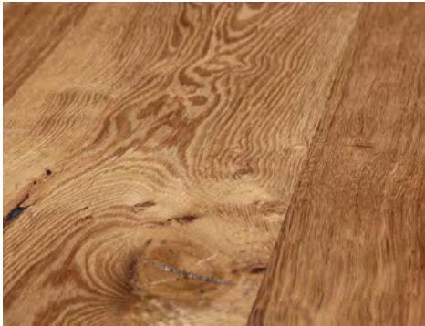
Farbspiel durch die geplante Zusammensetzung der Furniere.