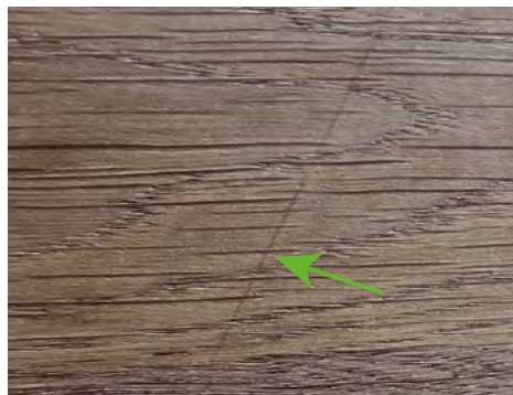
Abzeichnung der Furniermesserung

Für die Herstellung von Furnieren wird das Holz gemessert, das heißt in dünne Schichten geschnitten. Da das Furnier nicht geschliffen wird, kann eine Furniermesserung in Form von schräg verlaufenden Abzeichnungen sichtbar sein.